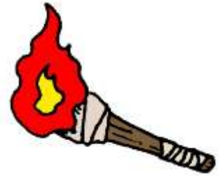
たいまつ ※1 松明

このお寺では、鬼追いが姫路で一番早く行われます。赤鬼、青鬼が山から出てきたように椎の木をくぐって現れます。鬼は踊った後、松明(※1)を持って寺の中を歩きます。