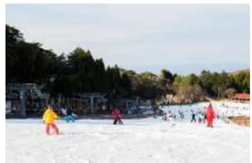
六甲山スノーパーク

寒い季節は家の中で過ごすことが多くなります。雄大な自然の中で真っ白な雪の上を滑るのはとても爽快で気持ちの良いものです。この冬にウインタースポーツを始めてみませんか。