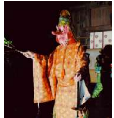
さる た ひこ ※2 猿田彦

う すきはちまんじんじゃ がつ さいしゅう ど よう び ひめ じ し あ ぼく みやうち 魚吹八幡神社 (3月最終土曜日) 姫路市網干区宮内193