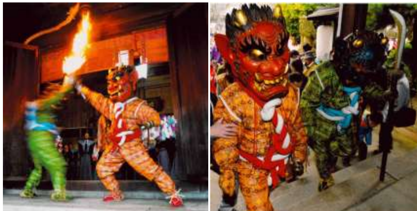
ひめ じ じんじゃ おに お 姫路神社の鬼追い