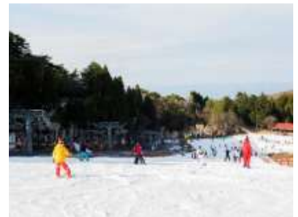
六甲山スノーパーク

寒い 季節は 家の 中で 過ごすことが 多くなります。 白い 雪の上を 滑ることは とても 気持ちがいいです。 冬の スポーツを 始めませんか。