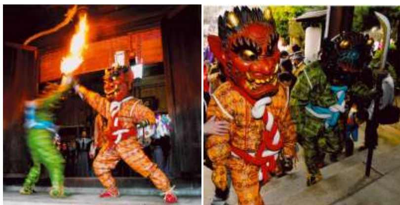
ひめじ じんじゃ おに お 姫路神社の鬼追い

ほか おに お ます い やますいがんじ (2月11日)、はつしょうじ (3月 第1日曜日) おこな その他の 鬼追いは、増位山随願寺 (2月11日)、八正寺 (3月 第1日曜日) で 行われます。 (行く まえ ひ 前に、日を 調べて ください。)