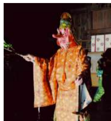
ざる た ひこ ※2 猿田彦 ※2

あかおに あおおに やま うえ はくさんごんげんしゃまいでん ま にでんない おど 赤鬼と 青鬼が、山の 上の 白山権現社舞殿と 摩尼殿内で 踊り ます。