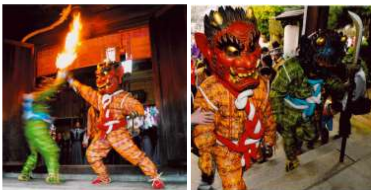
Oni-oi no Templo Xintoísta Himeji