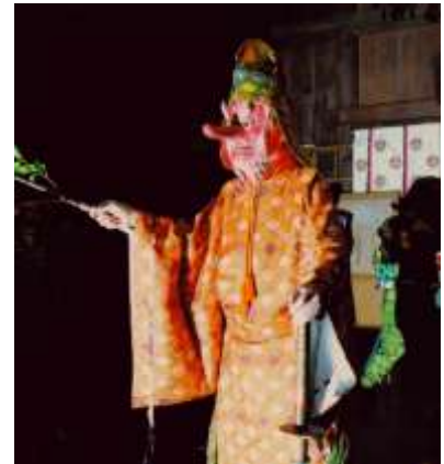
ざる た ひこ 猿田彦 ※2

ざる た ひこ 猿田彦（※2）与赤鬼、青鬼、小鬼们一起在神社里并排走。赤鬼和青鬼还会碰撞手中的 たいまつ 松明跳舞。