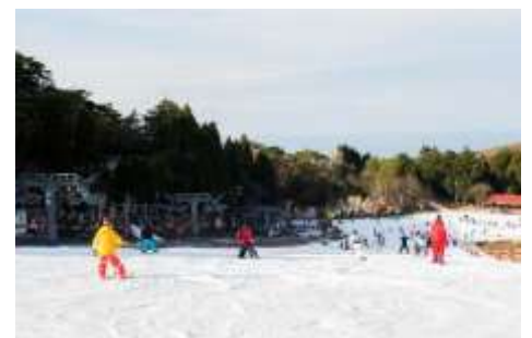
六甲山スノーパーク

寒冷的季节，我们常常待在室内。在壮丽的自然风光中，洁白的雪地上滑雪，令人神清气爽，无比惬意。