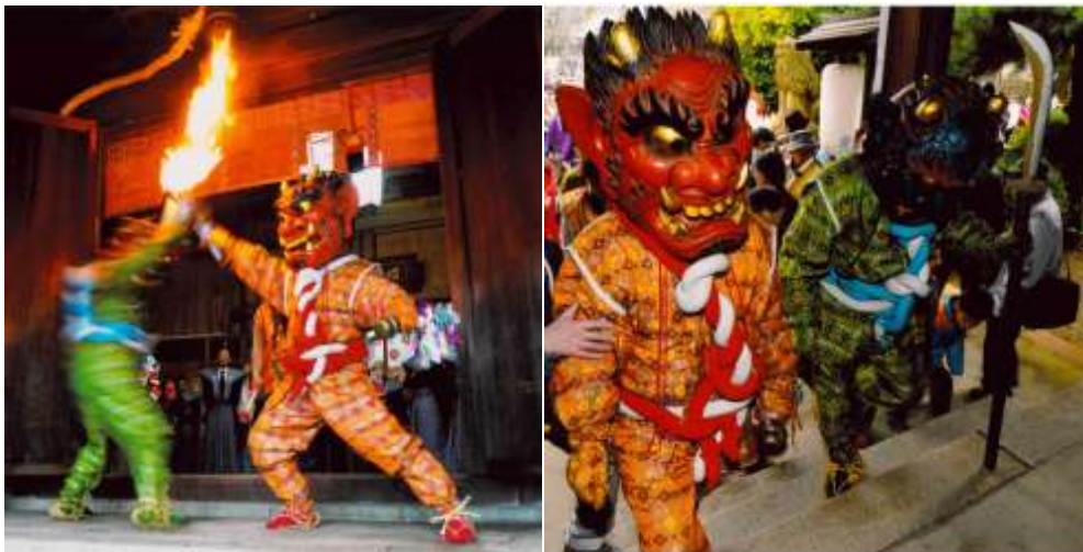
おに お 姬路神社の鬼追い

其他的 おに お 鬼追仪式在增位山随愿寺（2月11日）、八正寺（3月第一个星期日）举行。（举办日期请自行确认）