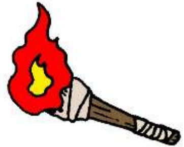
たいまつ 松明 ※1

这个寺庙的 おに お 鬼追仪式是姬路每年最早举行的。赤鬼和青鬼低身从椎树下钻出，就像是从山中现身。鬼先是跳舞，然后手持 たいまつ 松明（※1 火炬）在寺庙中走动。