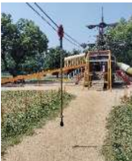
※ミニジップライン