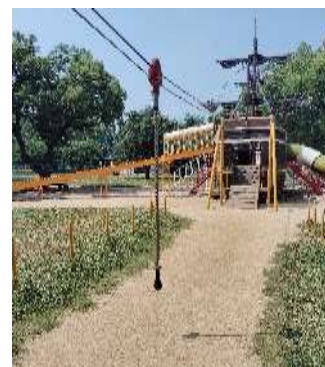
※ミニジップライン