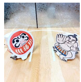
ロボット力士と遊ぶ

※2025年の詳しい日程や内容は、ウェブサイトやInstagramなどで確認してください。