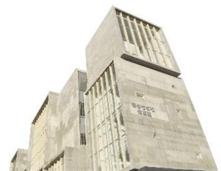
ものづくり体験館

特に夏休みの体験講座では、木製ティッシュケース、錫を使ったオブジェやキーホルダー、皮革を使った財布などを作ります。また、ロボット力士を作って遊ぶことができます。いつもは、あまり触る機会がない材料や道具、特別な技術を使い、職人から直接教えてもらうことができます。ものづくりの楽しさを体験できる良い機会ですので、ぜひ行ってみてください。