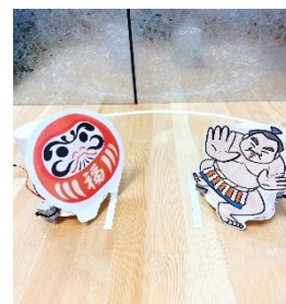
ロボット力士と遊ぶ

※2025年の 日程<講座がある 日や 時間>や 内容<どのようなことをするか>は ウェブサイトや インスタグラムなどで 見て ください。