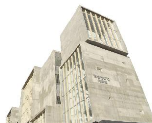
ものづくり体験館

夏休みの 体験講座<勉強会>では、木で ティッシュの 箱を 作ります。金属で 置物やキーホルダーを 作ります。動物の 皮で 小銭入れ<お金を 入れる 小さな 袋>を作ります。ロボットの 力士<すもうをする 人>を 作って 遊びます。いつもは あまり 触ることが できない 材料や 道具を 使います。特別な やり方を します。よく わかっている 人が 教えます。楽しく ものを 作ることができるので、ぜひ 行って ください。