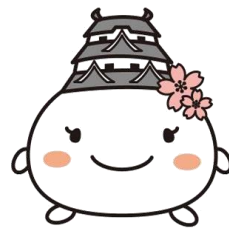
姫路市キャラクター しるまるひめ