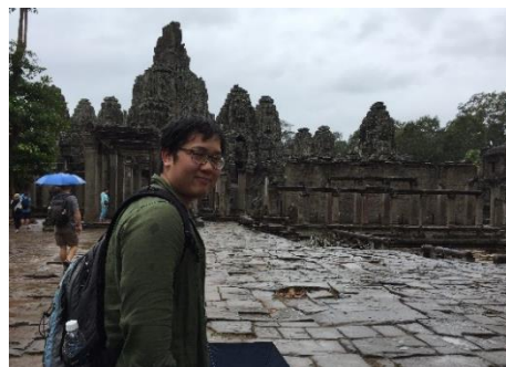
アンコール遺跡で

A 日本の働き方や職場での習慣を学び、それを活かして、いつかカンボジアで、ものづくりの会社を創りたいです。