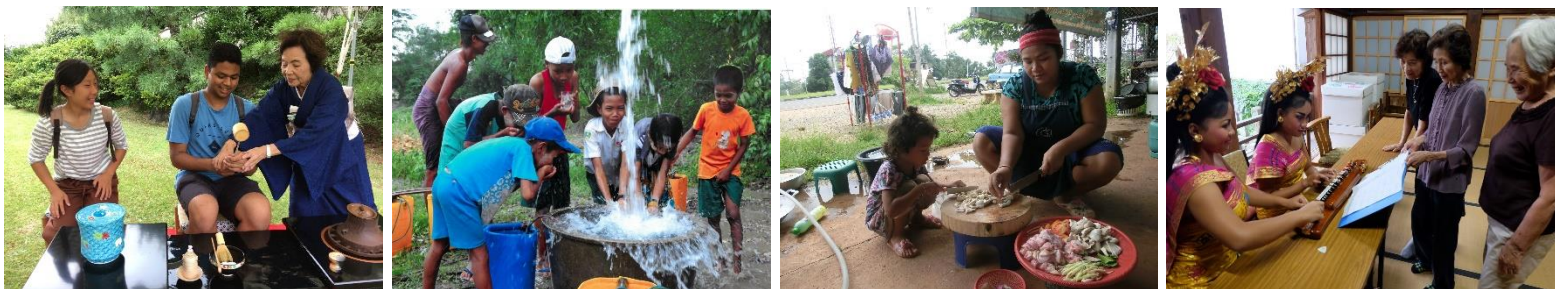
(写真はすべて昨年度の入賞作品)