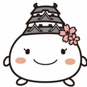
姫路市キャラクター しろまるひめ

スクールに参加して、世界のさまざまな国や文化を知り、国際交流や多文化共生について楽しく学びましょう！