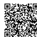
Công viên Sakurayama

Nằm ở phía tây Himeji bao gồm viện khoa học Himeji, viện Hoshinoko, viện trẻ em tỉnh Hyogo, viện quan sát rừng tự nhiên tp Himeji, quảng trường cỏ xanh rộng lớn. Và là nơi có yamasakura(hoa sakura rừng) vào mùa xuân và lá đỏ vào mùa thu tuyệt đẹp. Nơi mà chúng ta vừa ngắm thiên nhiên vừa có thể học tập.