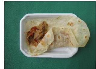
生地から手作り ピリ辛の メキシコの国民食