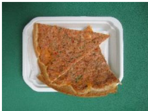
見た目はピザ！味はシリア！