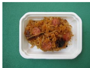
母から娘に受け継がれる 各家庭の味