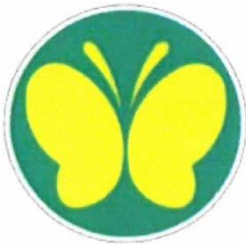
みどりいろ 緑色に きいろ 黄色のイラスト

きけんぼうし ばあい のぞき、このまーくをつけたくるまはばよせやわり込みを行 った運転者には、道路交通法の規定により罰せられます。