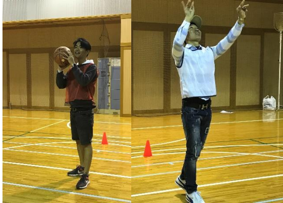
きゅう きゅうしんちょう 1球、1球 慎重に……