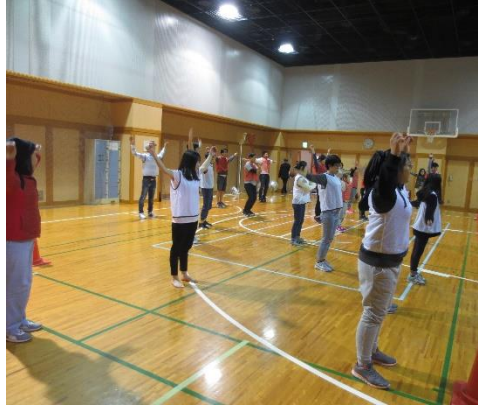
きょうぎまえ 競技前にしっかりストレッチをしました！