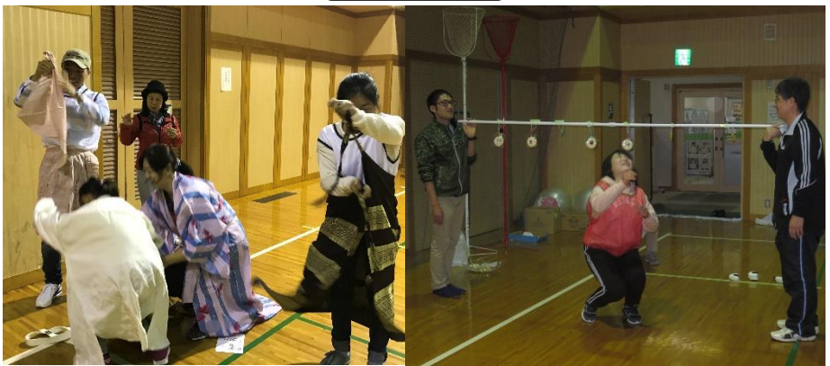
うんどうかい いちばん みどころ この運動会の一番の見所です！