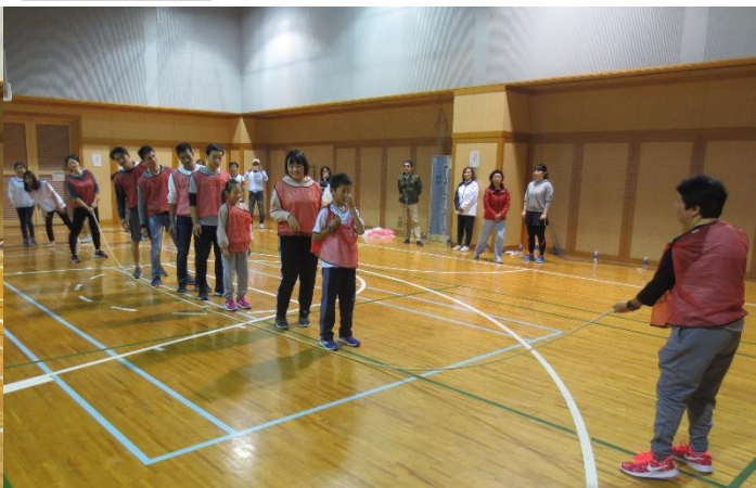
チームメイトを信じてジャンプ、ジャンプ！

今回の運動会は、例年に比べて参加者が少なかったようですが、紅白に分かれた学習者たちは国や年齢など関係なく一丸となって各競技に挑みました。障害物競走や玉入れ、リレーなど大いに盛り上がり、特にリレーでは白熱した戦いが繰り広げられました。転倒者が出るハプニングもありましたが、大事に至らず安心しました。また、人数の関係で急きよ私も参加することになり、久しぶりに全力疾走しました…。