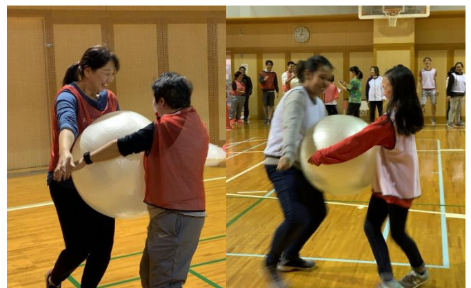
て つか ふたり いき あ 手を使わず、二人の息を合わせて1, 2, 1, 2!