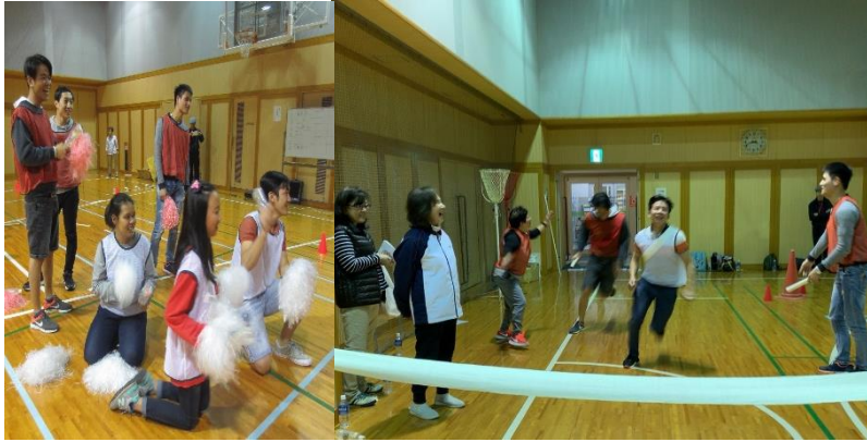
チームの声援を力にして、一生懸命走りました！