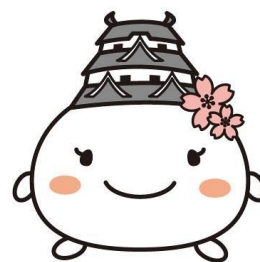
姫路市キャラクター しろまるひめ