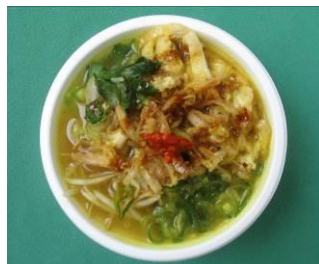
印度尼西亚: Soto ayam