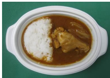
缅甸: Kyet tha hin