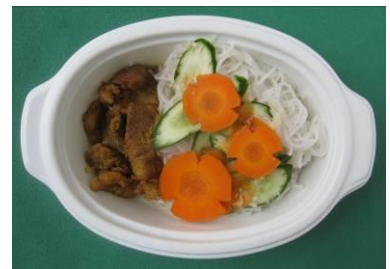
越南: Bún Chả