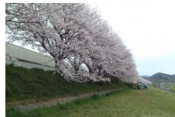
梦前川沿岸の桜花树

【交通】从姫路站转乘神姫巴士（开往山崎方向），在「安志」站下车，向北徒步 15 分钟。