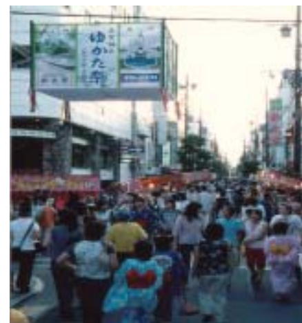
Fiesta de Yukata