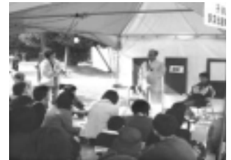
Corner do entendimento das crian as s bre Diversas Culturas

Com venda de famosas comidas e artigos para presente de Himeji, venda de comidas pelos restaurantes estrangeiros famosos em Himeji e, apresenta o de empresas com atividades no exterior e das ONGs (Organiza es N o Governamentais).