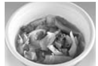
Comida polonesa [bigos]