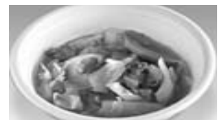
ポーランド料理 ビゴス 「ビゴス」

民族衣装の試着や、オーストラリアのアボリジニアートの体験、アジアやヨーロッパの9か国語を体験できる語学講座などのブースがあります。また、ふれあい広場では、カフェコーナーを設けて、フラダンスなど世界のパフォーマンスや文化紹介を楽しみ体験できます。