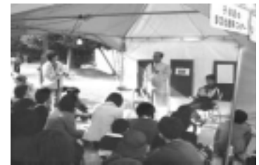
子ども 多文化理解コーナー 子供たちの多文化理解コーナー