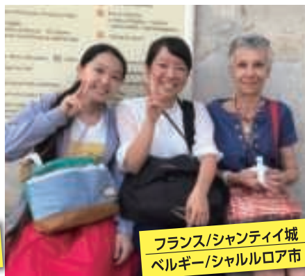
フランス/シャンティイ城 ベルギー/シャルルロア市