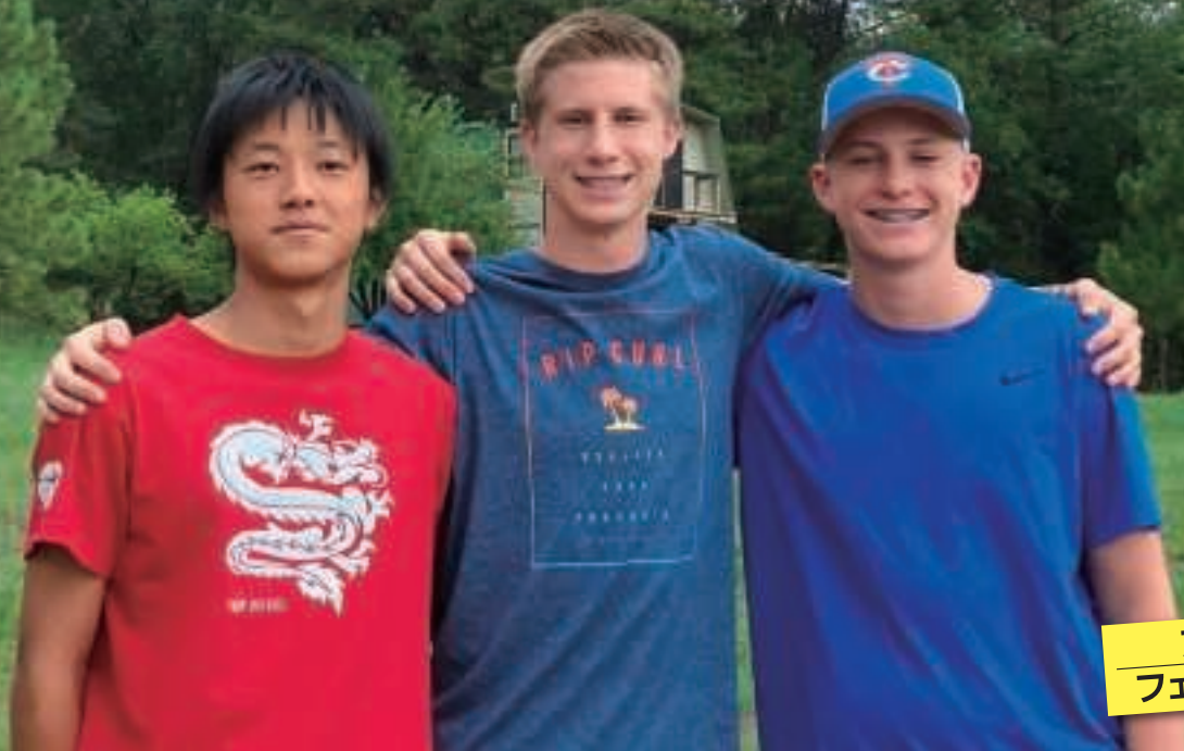
アメリカ フェニックス市