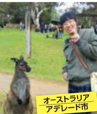
オーストラリア アデレード市