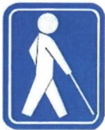
Ảnh minh họa màu trắng trên nền xanh

※Ký hiệu này có ý nghĩa “Dành cho tất cả các đối tượng là người tàn tật”. Không phải chỉ dành ưu tiên cho người sử dụng xe lăn.