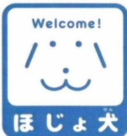
Ảnh minh họa trên nền xanh

Là ký hiệu chó nghiệp vụ được sử dụng để giúp đỡ người tàn tật.