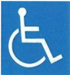
Ảnh minh họa màu trắng trên nền xanh

Trong bài viết này, chúng tôi xin giới thiệu các ký hiệu có liên quan đến người tàn tật. Chúng ta hãy cùng tìm hiểu ý nghĩa và mục đích của mỗi loại ký hiệu và cùng nhau xây dựng một xã hội tốt đẹp.