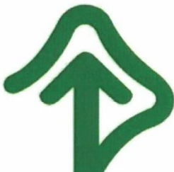
Ảnh minh họa màu xanh lá cây

Trừ trường hợp phòng tránh nguy hiểm. Theo quy định của Luật giao thông đường bộ thì những người điều khiển phương tiện giao thông nào ép làn, chen lấn, chen ngang đường với những xe có gắn ký hiệu này sẽ bị xử phạt theo quy định.