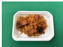
Hương vị gia đình mẹ truyền con nối