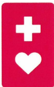
Ảnh minh họa màu trắng trên nền đỏ

Khi gặp ký hiệu này, xin hãy hiểu rằng đối tượng điều khiển phương tiện đó gặp vấn đề về thính giác. Do đó, hãy chú ý cách thức và phương pháp trao đổi nếu cần phải giao tiếp.