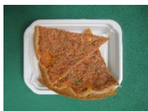
Về ngoài Pizza! Vị Syria!