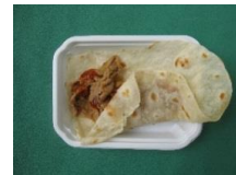
Món ăn cay nồng truyền thống của Mexico, được làm thủ công