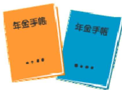
画像一ゆうちよくらぶ

http://www.yucho-club.jp/secondlife/01/c-1-10.html